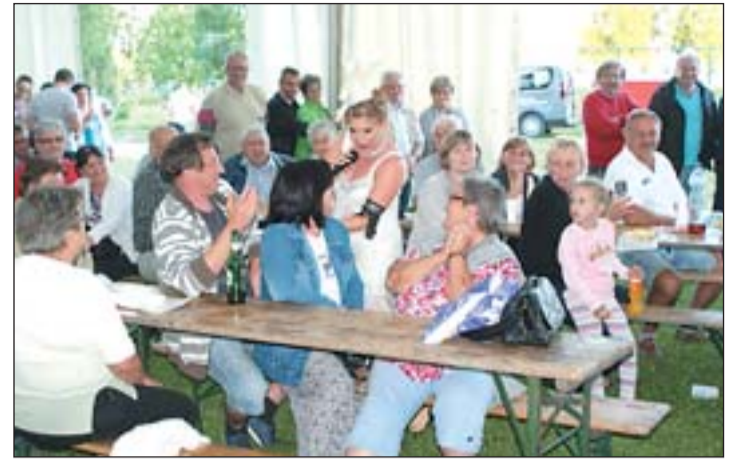
Közös éneklés a falunapon

az egytátelek kategóriájú főzőversenybe.