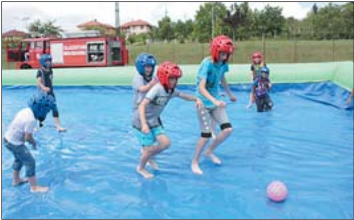
Vízifoci a gyermeknapon

Profi előadóművészekkel színvonalas falunapot tartottak Zalaszentivánon, az ötórás műsorban sokféle zenei műfaj képviseltette magát. A rendezvényt az Emberi Erőforrás Fejlesztési Operatív Program „Védőháló a családokért” című felhívásának keretében valósította meg az Élhetőbb Zalaszentivánért Közhasznú Egyesület.