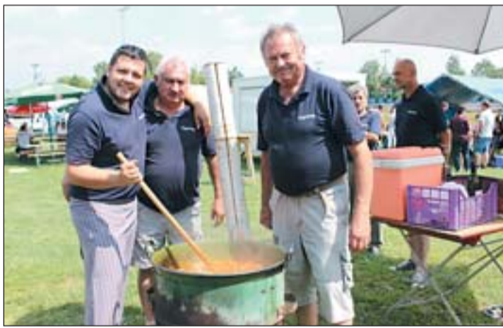
A helyi polgárőrök csapata a fakanálánál