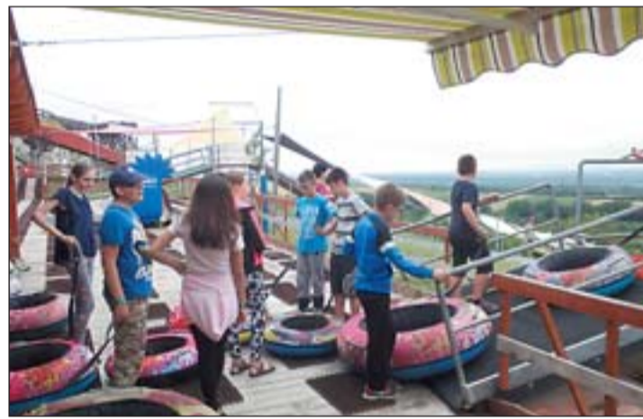
Újabb élményre várva a zalasabari kalandparkban